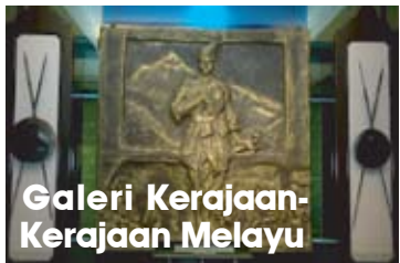
Galeri Kerajaan-Kerajaan Melayu

Ikutilah aktiviti-aktiviti yang menarik bagi membuka minda pelajar!