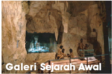
Galeri Sejarah Awal

Terokailah khazanah sejarah dan warisan budaya Malaysia di Muzium Negara!